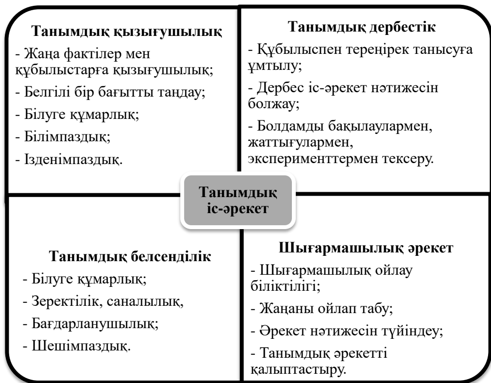
Сурет 2 - Танымдық іс-әрекеттің құрылымы

қалыптастыру мәселесіне зерттеушілер, педагогтардың, әдіскерлердің көптеген еңбектері арналған.