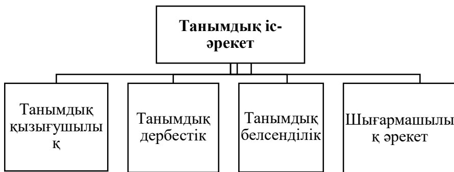
Сурет 1 - Танымдық іс-әрекеттің түрлері

Таным теориясының басқа ғылыми теориялардан айырмашылығы бар.