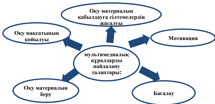
Сурет -3. Мультимедиалық құралдарды пайдаланудағы талаптар [4,5].

Қазақ тілі пәні бойынша мультимедиалық құралдарды қолдануға негізделген интерактивті тақтада жұмыс жаттығуларын (6-сыныпқа) жеңілден күрделіге қарай ұстанымы негізінде ұсынылады. Мәселен,